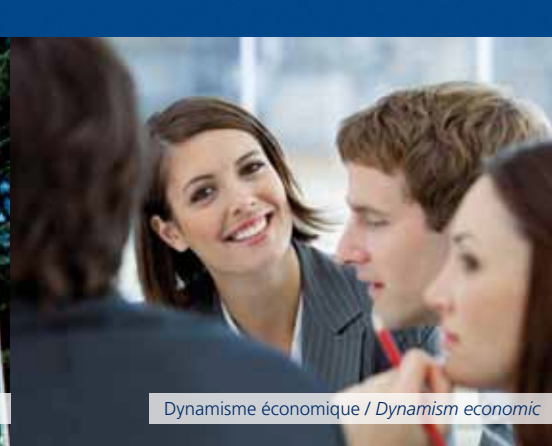
Dynamisme économique / Dynamism economic