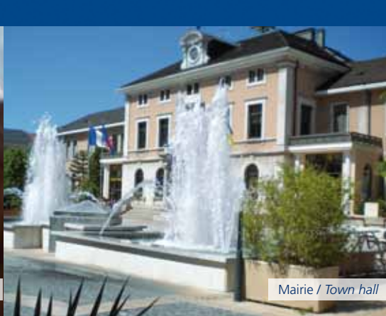
Mairie / Town hall