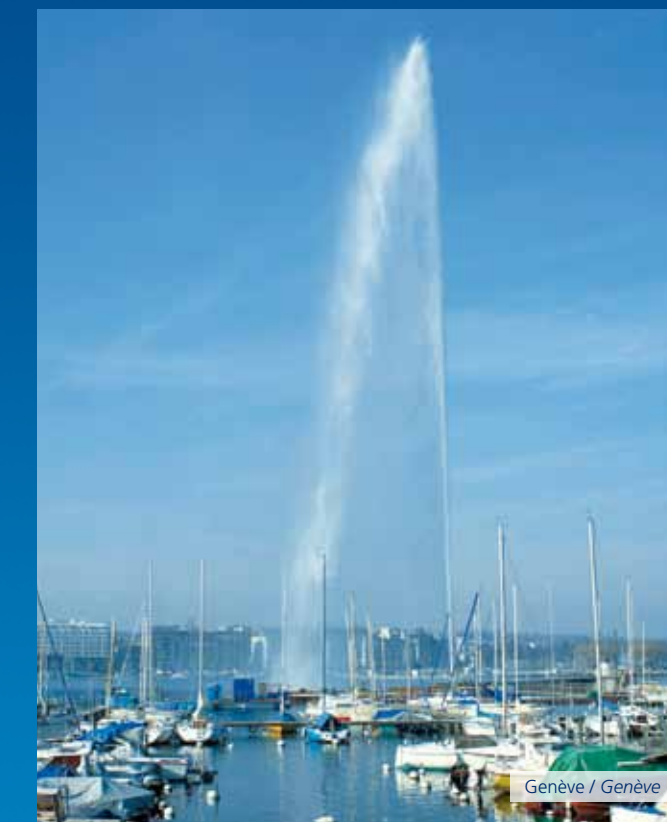
Genève / Genève

Property Investment in French City Centres The Creator of Complementary Income