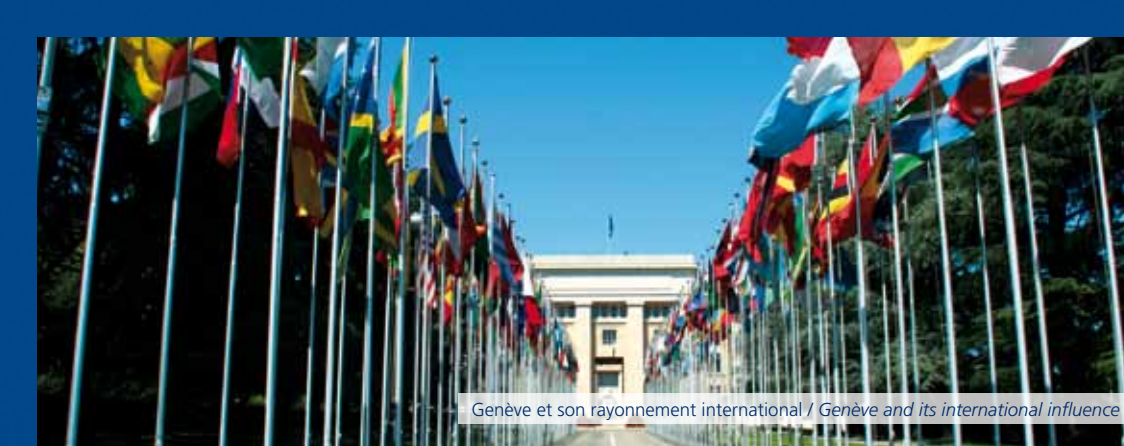
Genève et son rayonnement international / Genève and its international influence